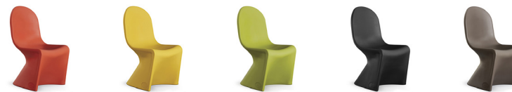
BLAZE ORANGE VEGAS YELLOW LIME GREEN BLACK THUNDER GREY