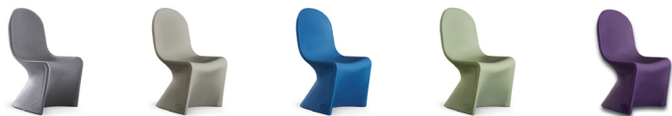
GRANITE MOONWALK GREY EPIC BLUE COOL GREEN ICON PURPLE